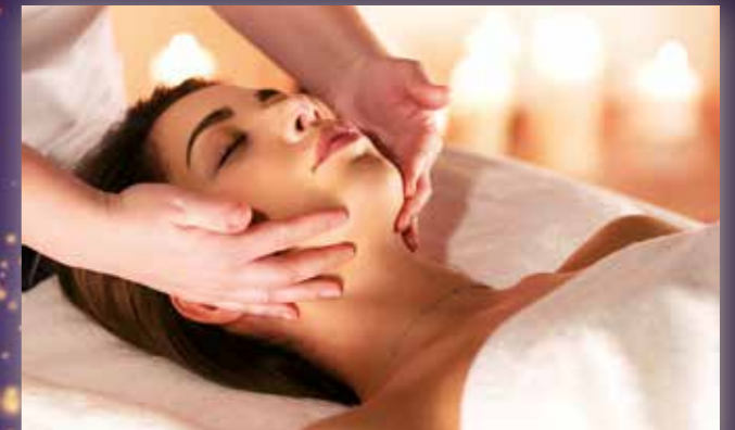
Sanfte Massagen für Ihr Wohlbefinden.