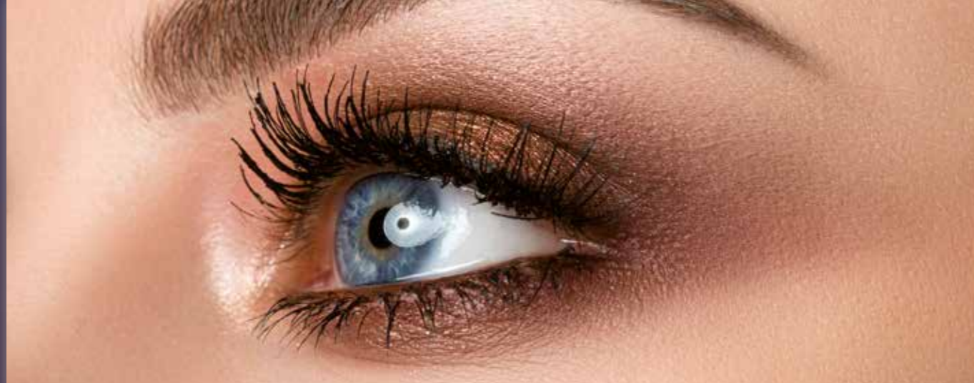
Individuelles Make up – perfekt auf Sie abgestimmt.