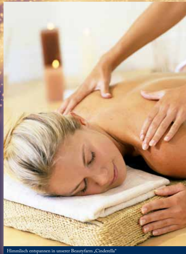
Himmlich entspannen in unserer Beautyfarm „Cinderella“