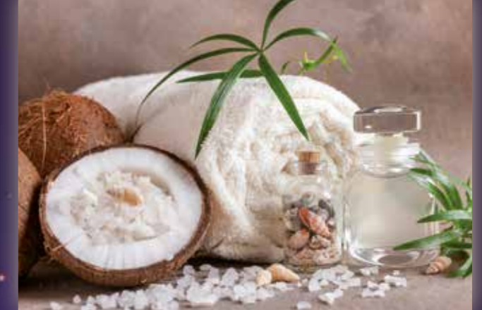
Regeneration und tiefe Entspannung